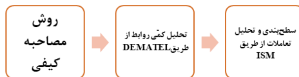
شکل ۱: فرآیند پژوهش

پژوهش حاضر از لحاظ هدف، کاربردی و از منظر گردآوری اطلاعات، از نوع آمیخته-اکتشافی است. این پژوهش دارای دو بخش کیفی و یک بخش کمی است. روش نمونه‌گیری در هر دو بخش کیفی و کمی به‌صورت هدفمند و از طریق روش گلوله برفی است.