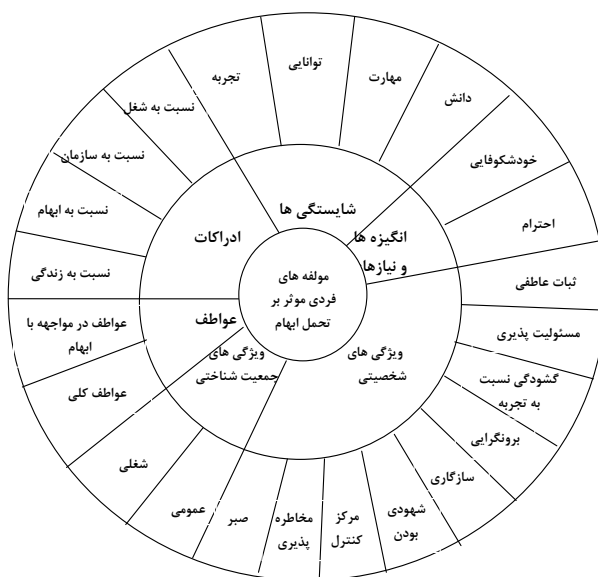
شکل شماره (۱) شبکه مضامین عوامل فردی موثر بر تحمل‌ابهام رهبران (منبع: مطالعات نگارندگان)

براساس تحلیل‌های انجام شده، شبکه مضامین مولفه‌های فردی موثر بر توسعه تحمل‌ابهام رهبران در شکل شماره ۱ نشان داده شده‌است.