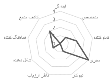
نمودار ۱۲- نقش‌های تیمی سابقه کار ۲۰-۳۰ سال