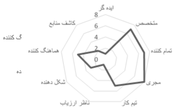
نمودار ۱۱- نقش‌های تیمی سابقه کار ۱۰-۲۰ سال